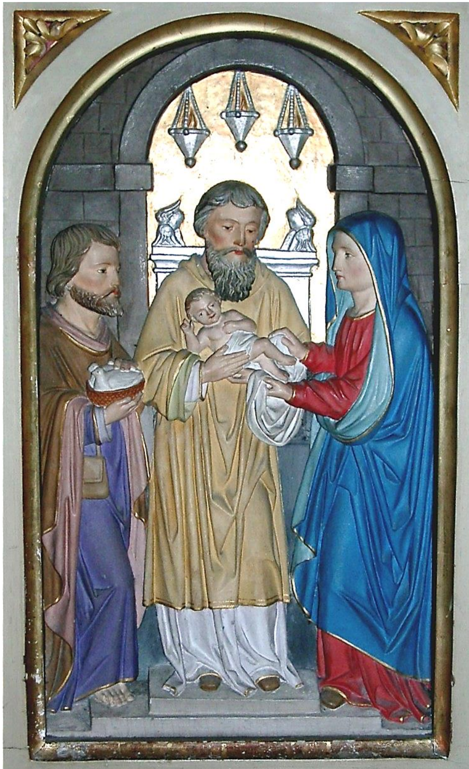
Darstellung des Herrn im Tempel – Mariä Lichtmess